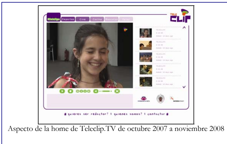
Aspecto de la home de Teleclip.TV de octubre 2007 a noviembre 2008

Este producto –que comenzó de modo embrionario como proyecto de investigación de la UCM en mayo de 2007- ha sido ya contratado por instituciones de prestigio (como Feria Madrid es Ciencia, Fundación UCM, Comunidad de Madrid, A3 Televisión, TVN de Chile), y ha acudido a diversas Ferias, como el American Film Market de California (2007), Mundo Internet (2008), las JTT/SIMO 2008 celebrada en la Universidad Politécnica de Madrid (2008) a iniciativa de la OTRI-UCM.