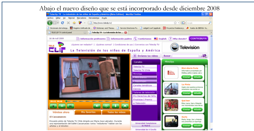
Abajo el nuevo diseño que se está incorporado desde diciembre 2008

Con el nuevo diseño de Internet Platform que E-TV lanzó en diciembre de 2008 estos canales serán más fáciles de usar e incorporar en otras web, mediante el “embed” o por incorporación de “mini-players” en otros sitios.