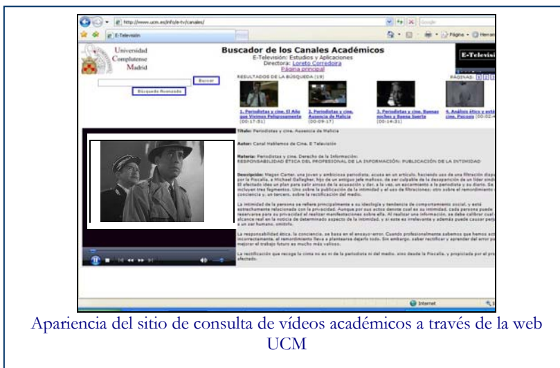
Apariencia del sitio de consulta de vídeos académicos a través de la web UCM

Además elaboramos productos de uso educativo como este Canal de vídeos para apoyo en clases sobre Cine que utilizamos en la Universidad Complutense ( www.ucm.es/info/e-tv/canales ) y que tiene un potencial de crecimiento exponencial en el área hispano-hablante .