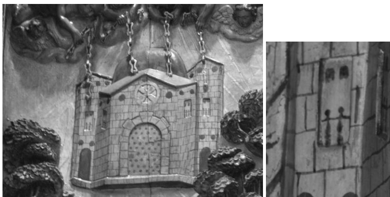
FIG. 2A-B. REPRESENTACIÓN DE LA IGLESIA FUNDACIONAL EN EL RETABLO BARROCO DEL MONASTERIO DE CORIAS.

En el detalle se puede apreciar la tipología de las ventanas geminadas abiertas en los paramentos.