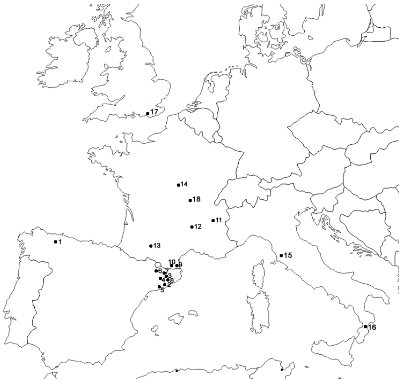
FIG. 5. MAPA CON LA DISTRIBUCIÓN GEOGRÁFICA DE LOS TEMPLOS