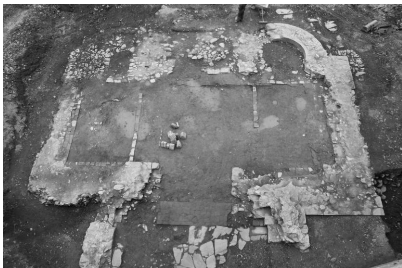
FIG. 3. VISTA GENERAL DE LOS VESTIGIOS ARQUEOLÓGICOS DE LA IGLESIA FUNDACIONAL LOCALIZADOS EN EL PATIO EXTERIOR OESTE DEL MONASTERIO

fundacional parecen indicar que se trataba de un edificio con una cubierta íntegramente abovedada, una solución constructiva que es habitual en el conjunto de templos relacionados con Corias cronológica y arquitectónicamente, y que procedemos a revisar a continuación.