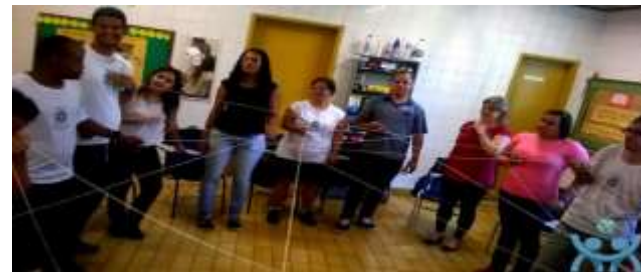
Agenda Acadêmica UFF 2014