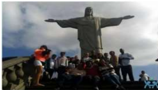
Agenda Acadêmica UFF 2014