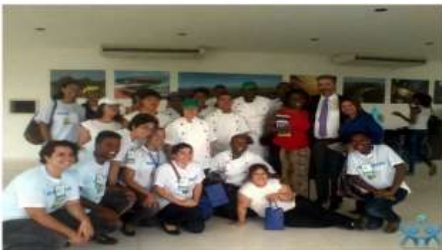
Salão Estadual do Turismo em 2013