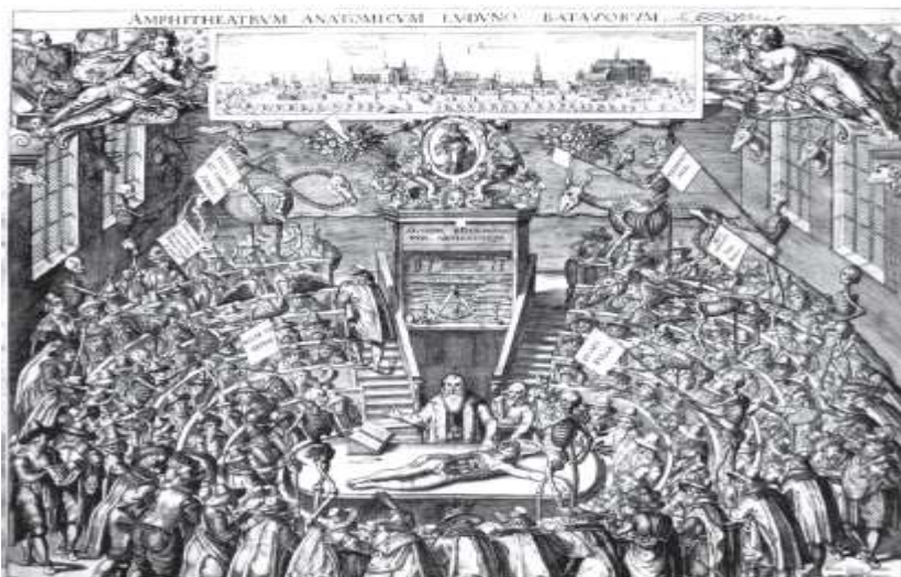
FIG. 5 Jan Cornelis van't Woudt, ou Woudanus, O Teatro Anatómico de Leiden , 1609.