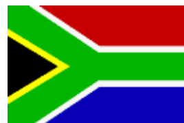
África do Sul