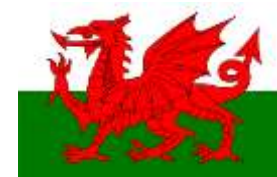
País de Gales