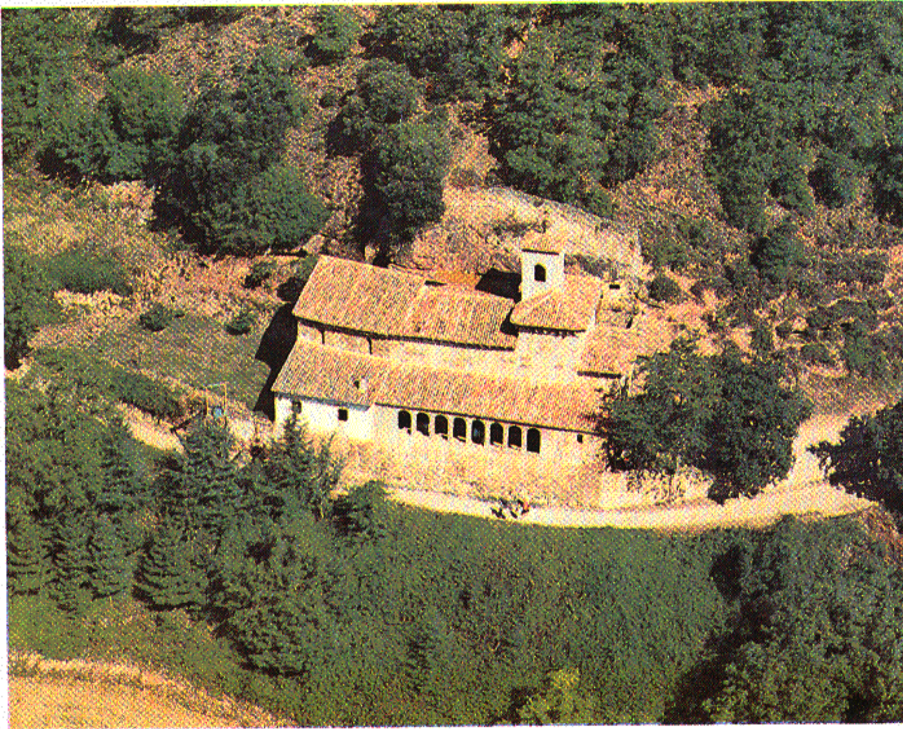
San Millán de la Cogolla: Monasterio de Suso.