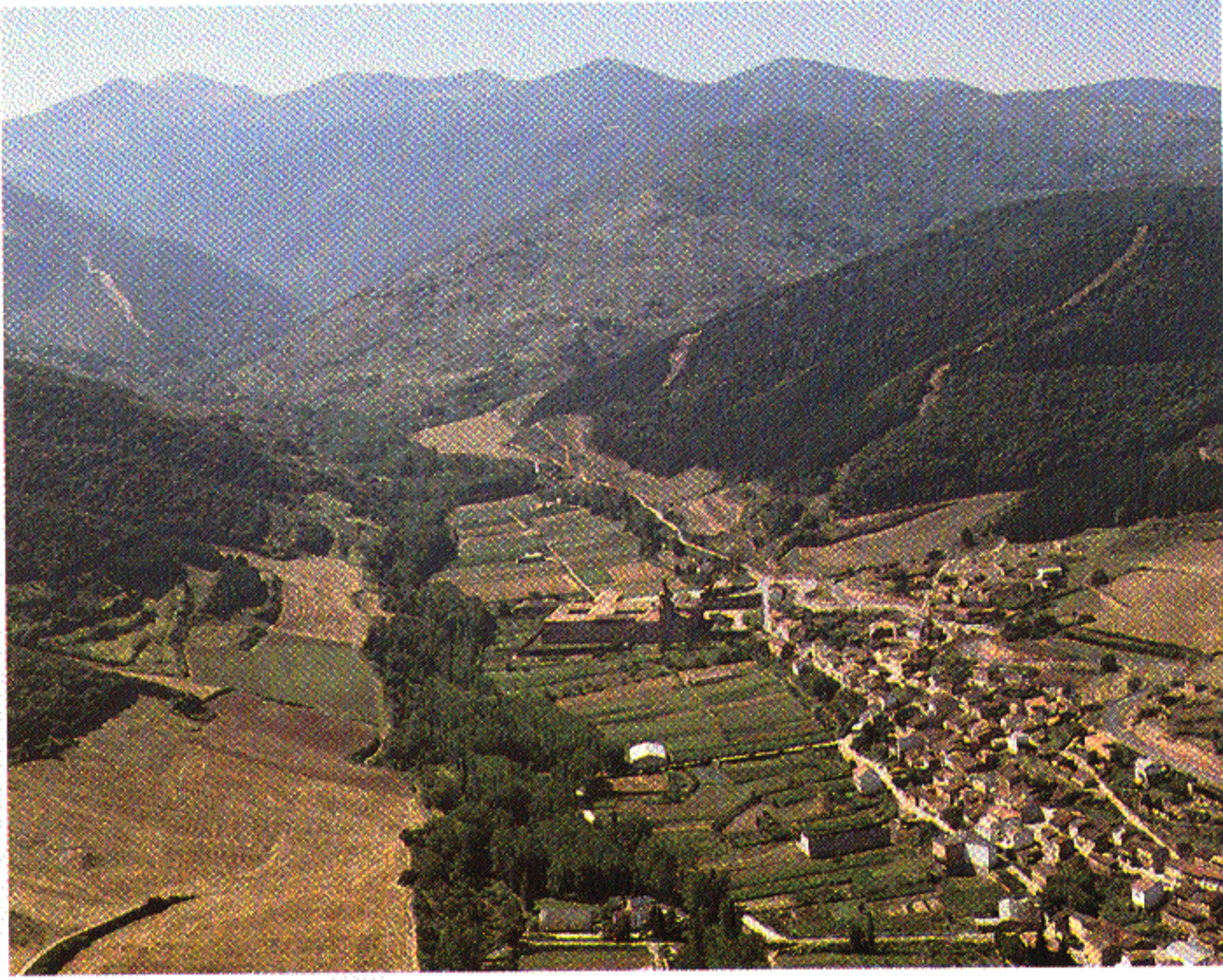
Valle de San Millán de la Cogolla.