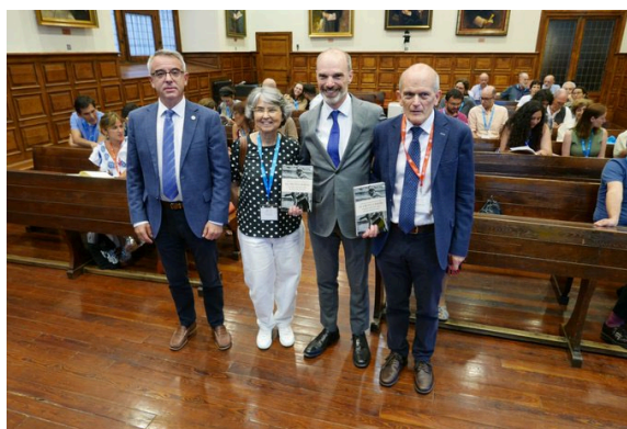
Fotografía 4. Presentación de libro.