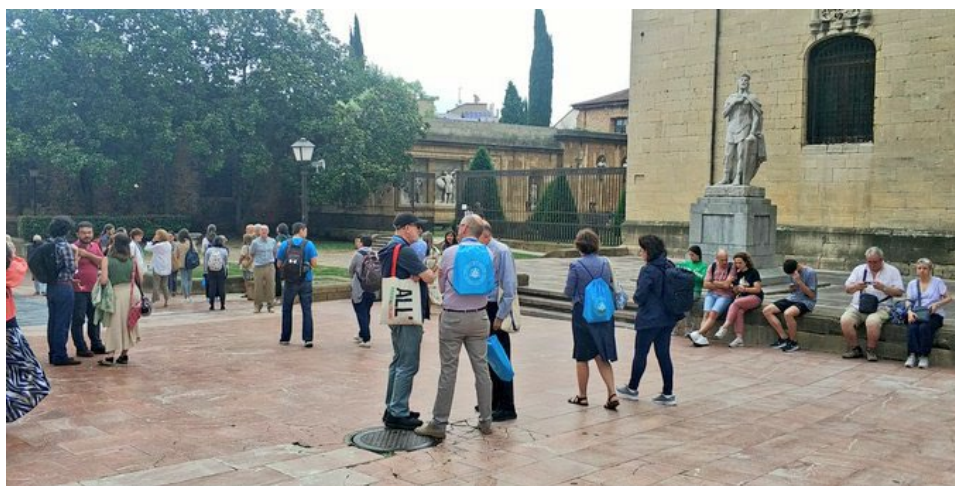
Fotografía 6. Visita guiada.