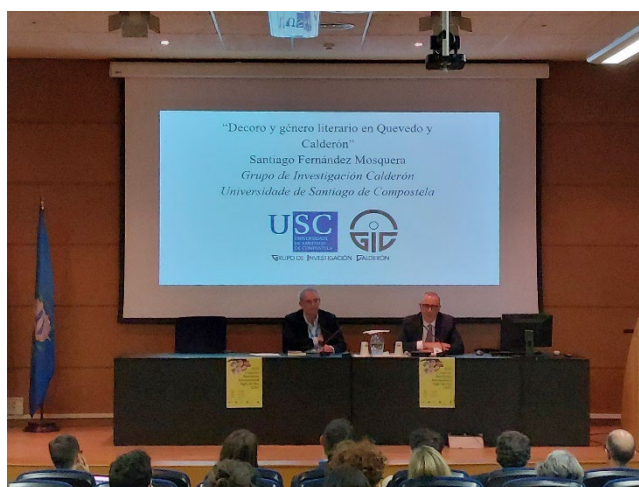
Fotografía 8. Conferencia de clausura.