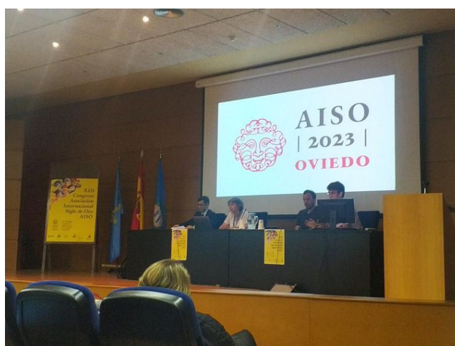
Fotografía 5. Asamblea de la AISO.