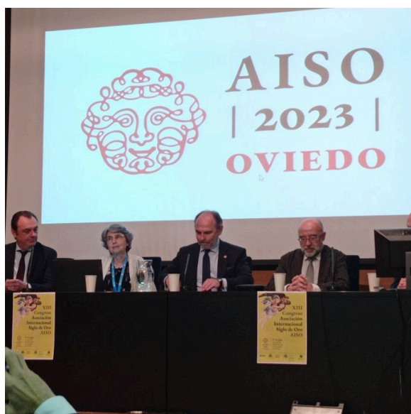
Fotografía 1. Inauguración del congreso.