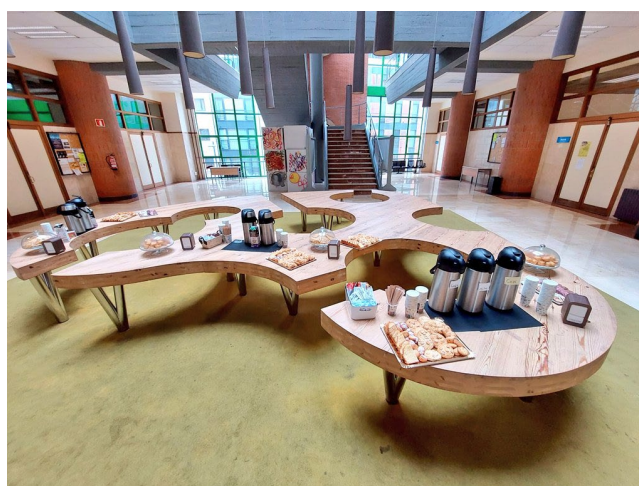
Fotografía 3. Pausa café.