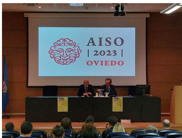
Fotografía 9. Clausura del congreso.