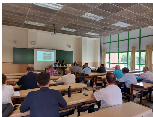
Fotografía 2. Panel de comunicaciones.