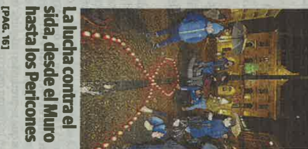
La lucha contra el sida, desde el Muro hasta los Pericones [PÁG. 16]