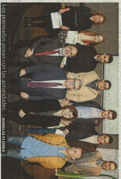
Los premiados posan con las autoridades.